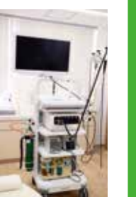
▲最新鋭内視鏡システム

りに炭酸ガスを注入することで、お腹の張りや痛み、違和感を軽減する効果があります。クリニックレベルで炭酸ガスを導入している施設はまだ少ないと思われます。また、鎮痛・鎮静薬を使用することで苦痛が少ないようにしています」。